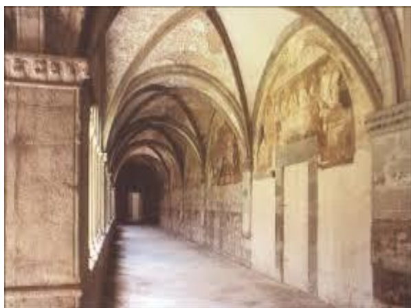
Chioostro del XIII secolo. Particolare

Tel/Fax 06 3545 3019; 333 279 1323 - E-mail:francocarlo.ricci@unitus.it