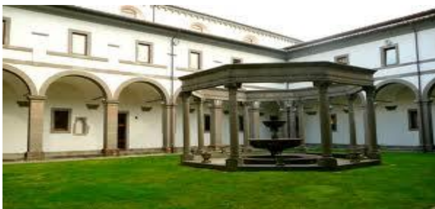
Chiostro Rinascimentale. Particolare

Info: Francesco Della Rosa. Tel. 0761.357.937; 348.793.1782. E-mail: delrosa@unitus.it